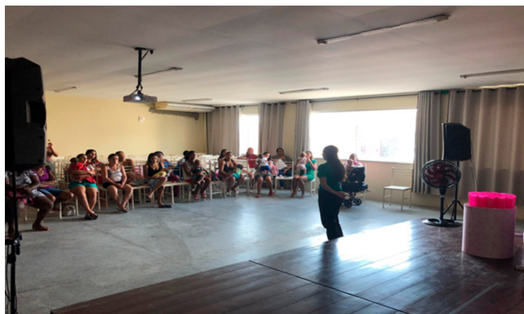
Figura 1 – Palestra realizada pelo grupo

No primeiro momento, ocorreu uma palestra educativa, com uso de vídeos e slides para tornar a abordagem mais dinâmica (FIGURA 1). Em seguida, promoveu-se um espaço de troca de experiências e esclarecimento de dúvidas por meio de perguntas anônimas, favorecendo a participação ativa e reduzindo barreiras hierárquicas entre equipe e público (FIGURA 2).