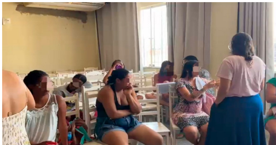
Figura 2 – Dinâmica para retirada de dúvidas