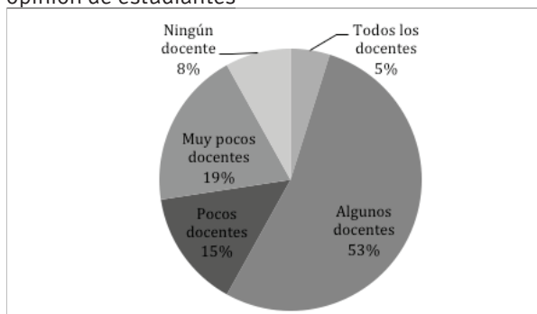
Imagen 3 – Uso de medios sociales por docentes en opinión de estudiantes